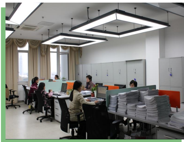
专业实践基地——教育部科技查新工作站