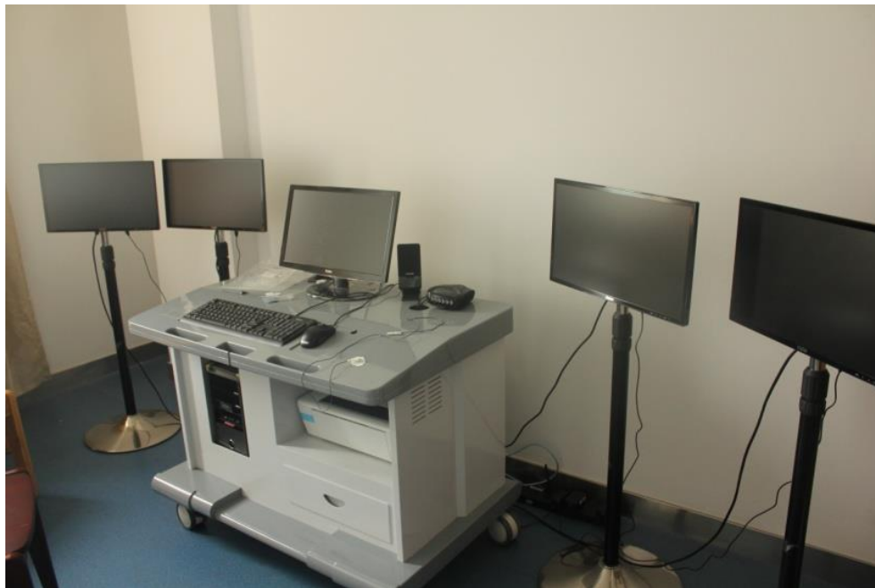
信息行为分析实验室：生理反馈设备