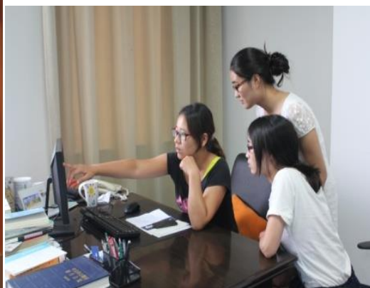
专业实践基地——亿佰特信息服务有限公司