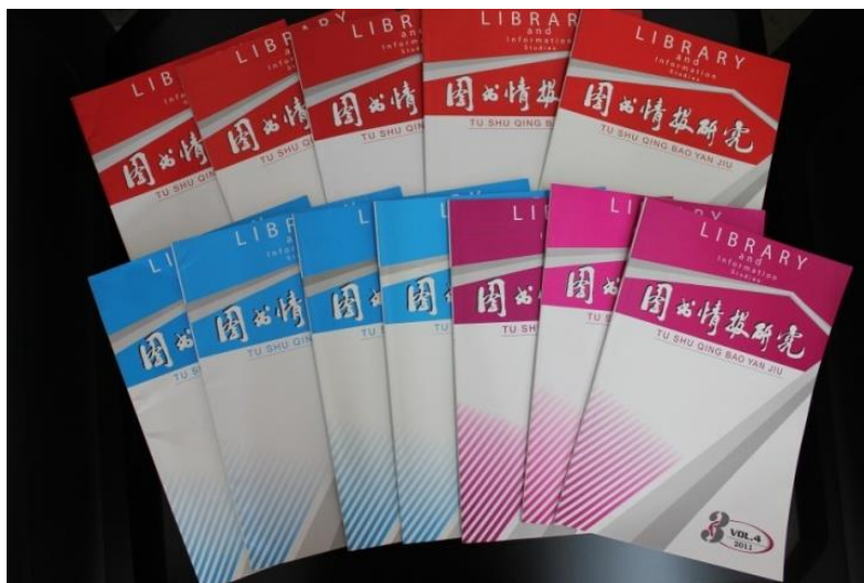
自办学术期刊——《图书情报研究》