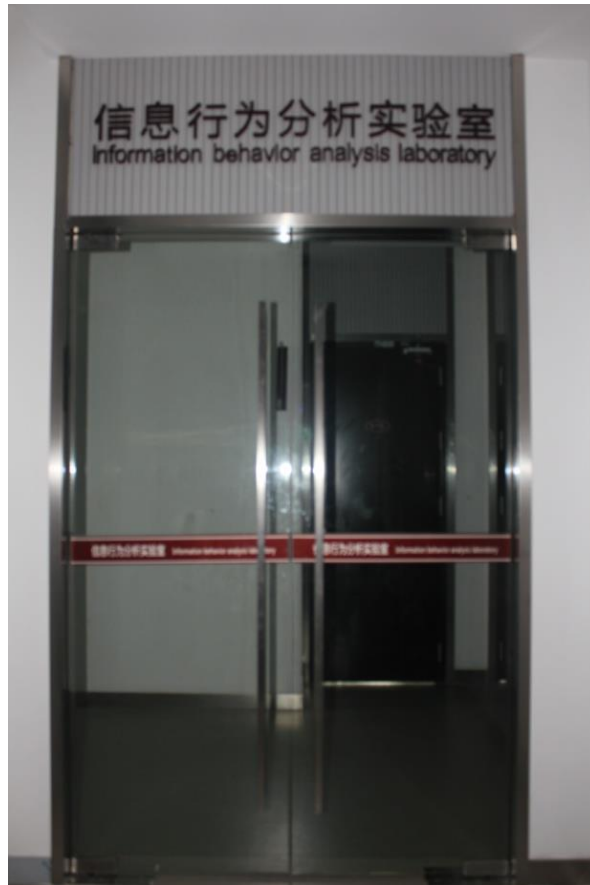
国内领先的信息行为分析实验室